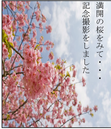
満開の桜をみて・・・ 記念撮影をしました