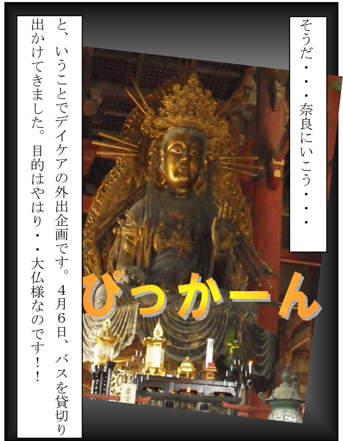
そうだ・・・奈良にいこう・・・