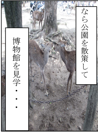
博物館を見学・・・